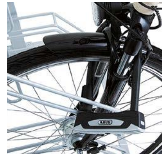
Optimierte Diebstahl-Sicherung. Befestigung am Fahrradrahmen.