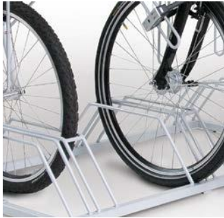
Sicherer und platzsparender Beidseitiger Radeinstand.