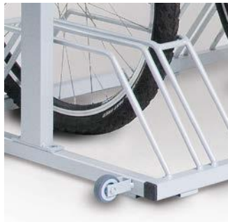
Praktisch leicht zu bewegen Durch seitliche Laufrollen.