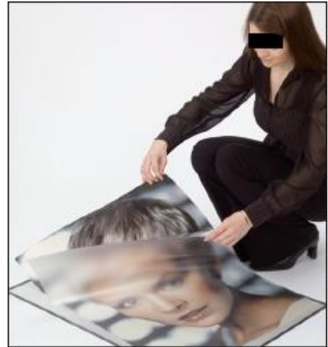
Mit zusätzlicher Folientasche, entspiegelt und wasserfest.