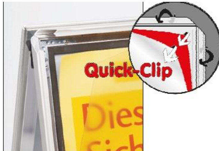
Alu-Klapprahmen – sekundenschneller Posterwechsel